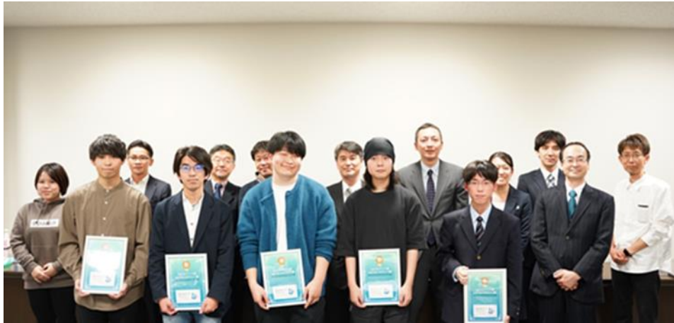
表彰式に参加した上位受賞者の方々、paiza 株式会社の方、中央大学高等学校の先生方ら

受賞者には、表彰状授与とともに、paiza 株式会社から同社特製 T シャツやキャラクタークリアファイルが副賞として贈呈されました。