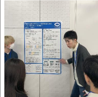
ポスターセッションの様子