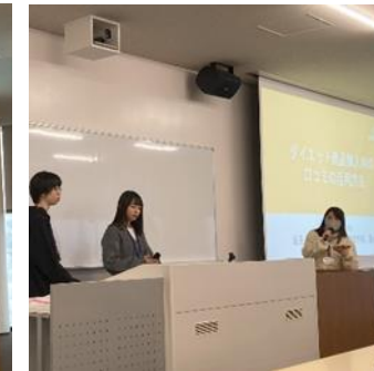
口頭プレゼンテーション2