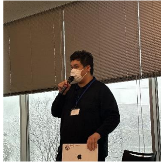
成果報告会実行委員

iDS 演習の4つのゼミに所属する学生が1年間の活動成果を口頭6件ポスター15件で発表し、お互いの交流を深めました。