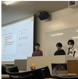
口頭プレゼンテーション1